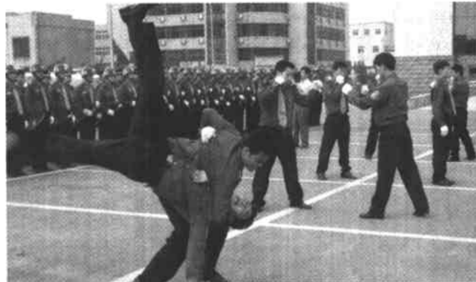
为进一步理顺油区治安管理体制，东营区和油田联合成立了100人的油区治安大队，下设4个中队，负责日常巡逻和涉油案件侦破工作，有效维护了油区治安的持续稳定。图为治安大队正在进行擒拿格斗训练。