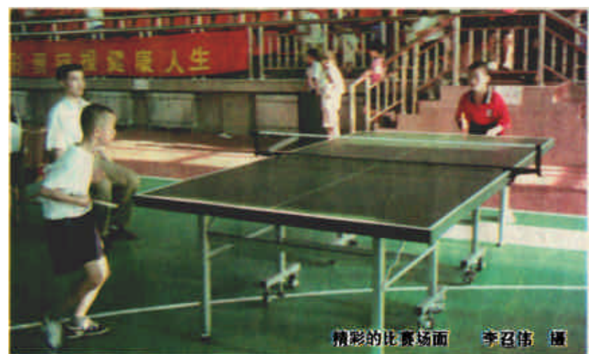
精彩的比赛场面